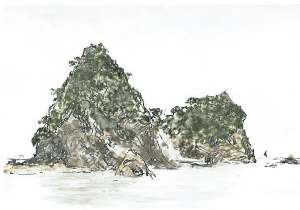
旅先でのキット作例（16*23cm）